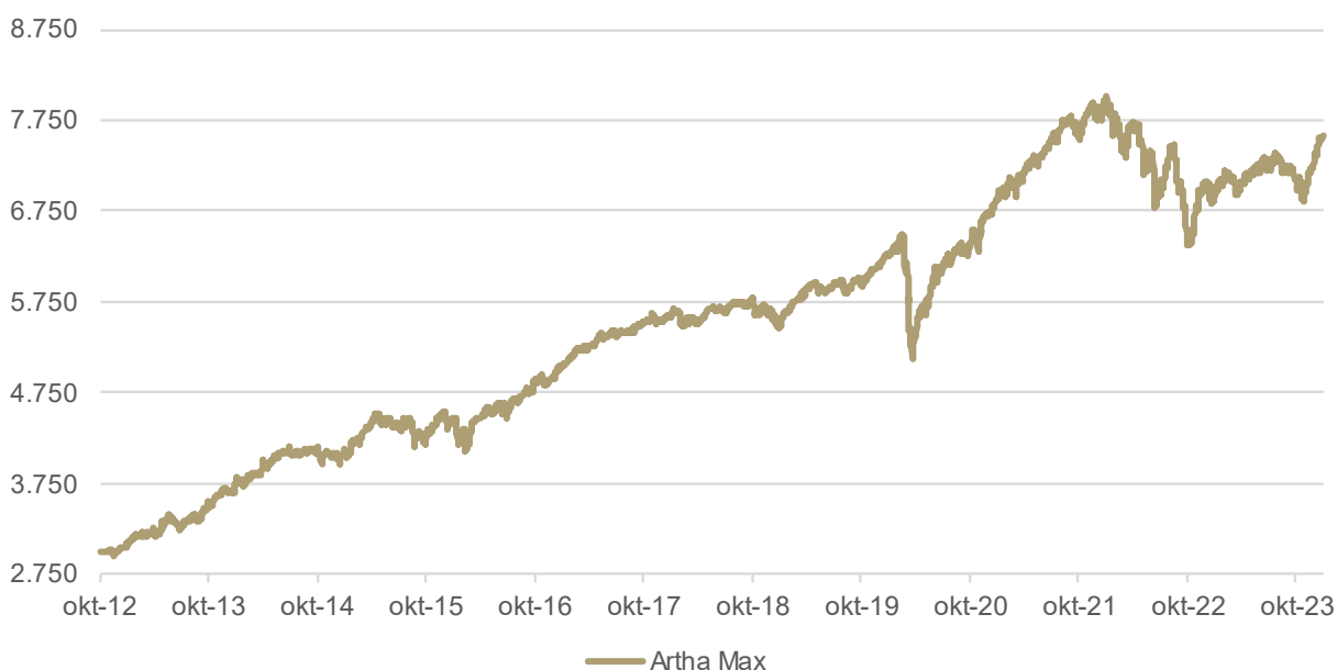
Daglige NAVs: 01-10-2012 til 31-12-2023

Nedenfor ses den historiske udvikling i Selskabets NAV: