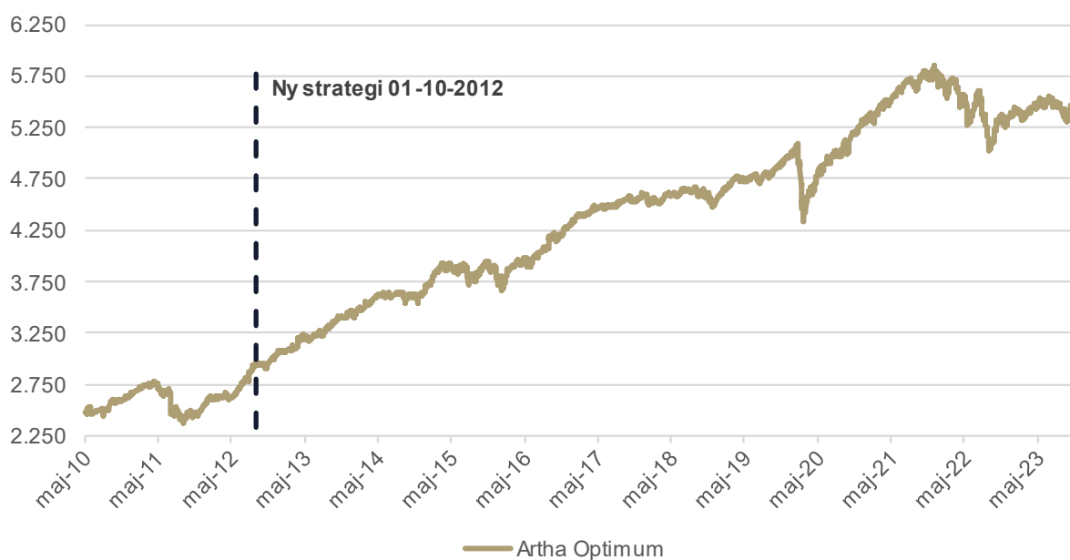
Daglige NAVs: 01-06-2010 til 31-12-2023

Nedenfor ses den historiske udvikling i Selskabets NAV: