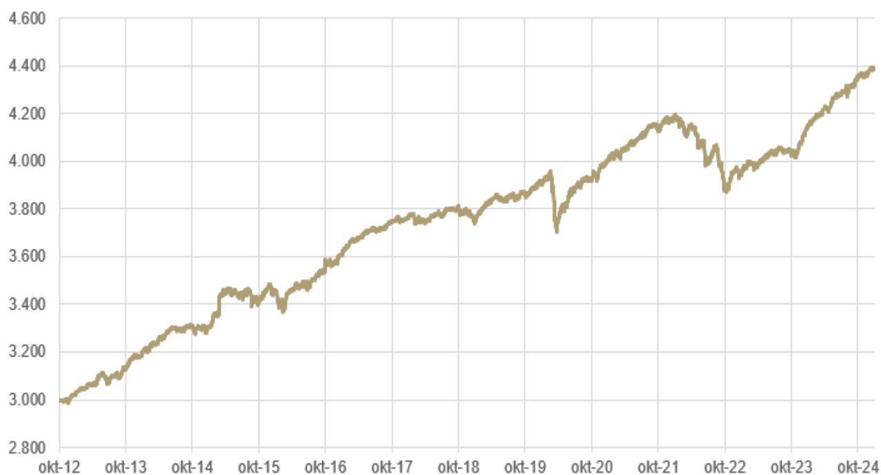
Figur 1: Daglig indre værdi for Investeringsselskabet Artha Safe A/S fra oktober 2012.

Selskabets indre værdi pr. aktie blev i 2024 øget fra 4.148 kr. primo til 4.384 kr. ultimo 2024 svarende til en stigning på 5,70 %.